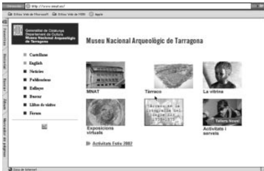
Pàgina web del Museu Nacional d'Arqueologia de Tarragona.

lunya, el Museu Etnològic d'Arbúcies o el Museu de la Vida Rural de l'Espluga de Francolí, que a més permet valorar la visita a través d'una minienquesta.