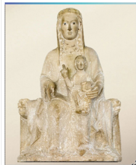
Mare de Déu del Claustre de Guillem Seguer (s. XIV), és una de les peces que es pot veure al web